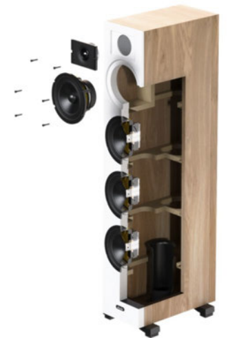
(H x L x P) : 925 x 180 x 300 mm Chêne Clair / Chêne noir. Poids : 14,1 kg

Ce modèle est principalement destiné pour des pièces de grande taille , ainsi que des espaces semi-ouverts de 16 à 25 m² . En raison de ses dimensions et de la conception de son coffret, l'enceinte offre une performance optimale lorsqu'elle est placée à environ 1 mètre du mur. La puissance de l'amplificateur recommandée pour le modèle Tesi 661 est de 30 à 160 W