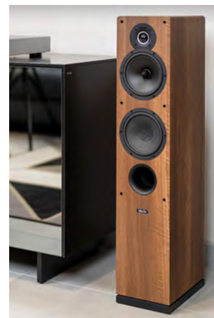
(H LxP) : 890 x 180 x 300 mm Chêne Clair / Chêne noir/ Blanc. Poids : 13.7 kg

L'évent bass-reflex est placé sur la façade avant, ce qui facilite l'installation de l'enceinte même près du mur. Le modèle Tesi 561 est conçu pour une utilisation dans des pièces d'écoute de taille moyenne, de 16 à 25 m 2 . Cette enceinte a une impédance de charge de l'amplificateur comprise entre 4 et 8 ohms, et la puissance de l'amplificateur nécessaire pour alimenter cette enceinte doit se situer entre 30 et 150 W.